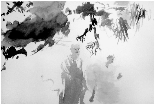
2005 - 41,8 x 29,5 cm (Tusche auf Papier)

Die Ausstellung im Internet ist der zauberhaften Aquarellmalerei gewidmet. Zur Ansicht meiner Aquarellwerke lade ich Sie herzlich auf die neue Webseite "www.kreienbuehl.name" ein.