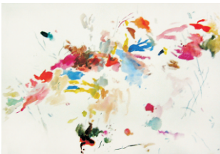
2005 - 40 x 30 cm (Aquarell auf Papier)

Die meisten dieser Aquarelle sind in Kamerun, Afrika, in der Umgebung von Yaounde, Douala und in den Bergen um Bamenda, entstanden. Ich machte oft morgens oder abends, wenn die Hitze nachgelassen hat, meine Aquarell-Spaziergänge auf die Hügel und in die kühlen, schattigen Täler der wunderschönen Stadt Yaounde. Die unbeschreibliche Vielfalt des Lebens dort ist eine fröhliche sprudelnde Quelle meiner Malerei.