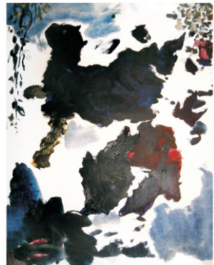
2005 - 30 x 40 cm (Oel auf Papier)

Der Tag oder die Nacht kommen schnell. In weniger als einer Stunde flammt am Himmel ein wildes Farbenspiel über Pflanzen, Tieren und Menschen auf.