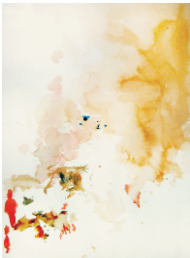
2005 - 30,4 x 45,3 cm (Aquarell auf Papier)