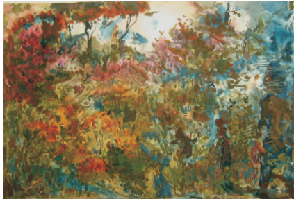
2005 - 41,8 x 29,5 cm (Aquarell auf Papier)