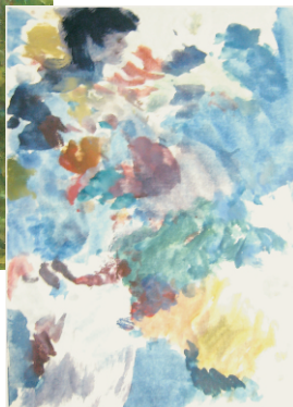
2005 - 30 x 40 cm (Öel auf Papier)