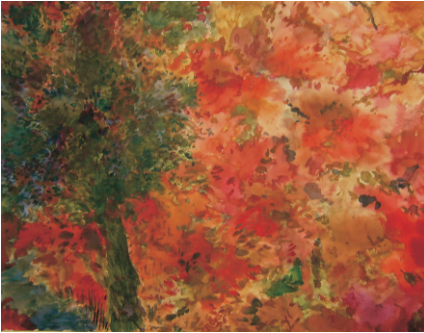
2005 - 50 x 39,8 cm (Aquarell auf Papier)