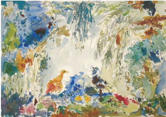
2004 - 41,8 x 29,5 cm (Aquarell auf Papier)

Die frische Brise vom Meer, die schreckliche Hitze und Feuchtigkeit im Hafen, die undurchdringlichen, von Schlangen und Krokodilen belebten Sumpfgärten um Douala sind nur durch den gelegentlichen Regen und eine schillernde Farbenpracht erträglich. Die Geheimnisse und Begierden der Farben werden da offenbar.