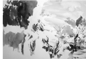
2005 - 29,5 x 41,8 cm (Tusche auf Papier)