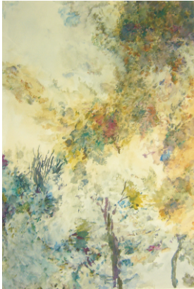
2005 - 30,4 x 45,3 cm (Aquarell auf Papier)

Aquarelle einer wiedererfundenen Malerei