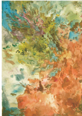
2005 - 29,5 x 41,8 cm (Aquarell auf Papier)