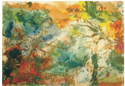
2005 - 41,8 x 29,5 cm (Aquarell auf Papier)