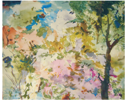
2005 - 50 x 39,8 cm (Aquarell auf Papier)