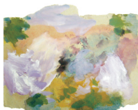
2005 - 21 x 15 / 17 cm (Öel auf Karton)