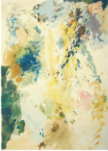
2005 - 29,5 x 41,8 cm (Aquarell auf Papier)