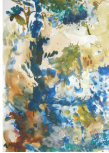
2005 - 29,5 x 41,8 cm (Aquarell auf Papier)