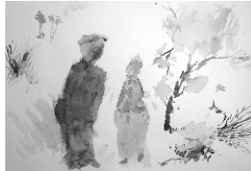
2005 - 29,5 x 41,8 cm (Tusche auf Papier)