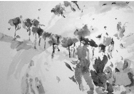
2005 - 29,5 x 41,8 cm (Tusche auf Papier)